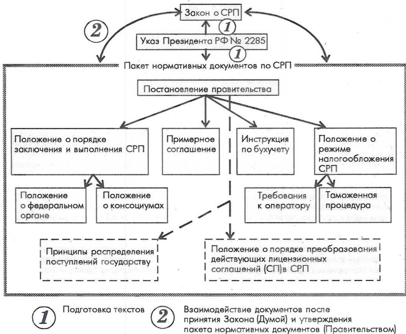
Рис. 2 Правовая структура применения СРП

на самых разных условиях привлечен даже в отрасли ВПК. Возможно широкое разнообразие договоров с иностранными инвесторами, заключаемых с целью получения технологий, раздела продукции, строительства объектов «под ключ», сервисного обслуживания.