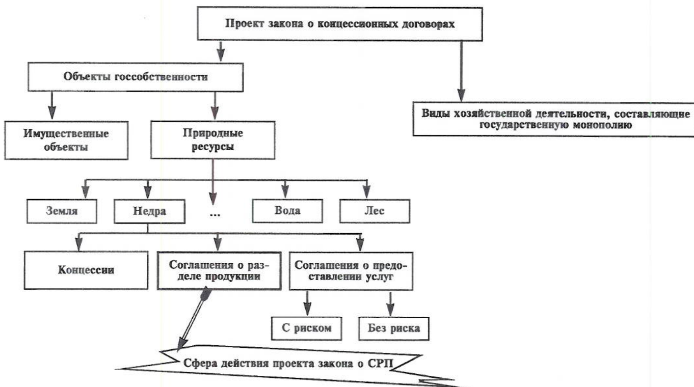
Рис. 2. Соотношение сфер действия проектов законов о концессионных договорах и о соглашениях о разделе продукции (по версии экспертной группы Комитета по экономической политике Госдумы)

Сфера действия закона о концессионных договорах