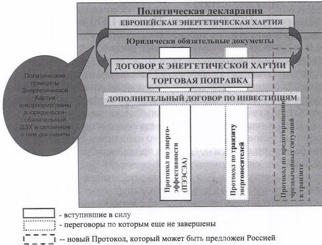
Рисунок 1. ДОГОВОР К ЭНЕРГЕТИЧЕСКОЙ ХАРТИИ И СВЯЗАННЫЕ С НИМ ДОКУМЕНТЫ

С другой стороны, после вступления ДЭХ в силу в 1998 году и в условиях временного применения его Россией многие российские министерства и ведомства в своем нормотворчестве опирались на правовые нормы ДЭХ (например, ФАС). Отказавшись от ДЭХ, Россия тем не менее сохранит его наследство частично инкорпорированным в российское законодательство. Придется местами заново переписывать российское законодательство, создавая дополнительные инвестиционные риски (таков результат любого переписывания любого законодательства, какими бы благими целями ни руководствовался законодатель, будь то российский или европейский, - инвесторам в первую очередь нужна стабильность "правил игры").